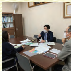
障がい・特別支援教育に 力をそそぐ