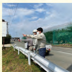
樽石川、現地調査(戸沢)