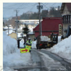
除雪、緊急対応(袖崎)