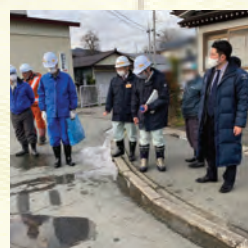
市道の消雪施設改良に 向けて県と調整(富並)