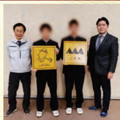
県立村山産業高校の 取組みを応援