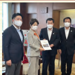
村山市重要事業 知事要望