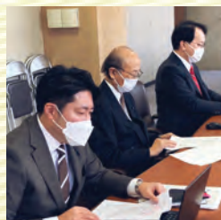
国・県に対して雪対策に関 する要望活動