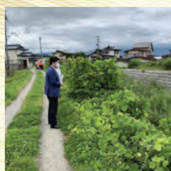
大旦川、現地調査(大倉)