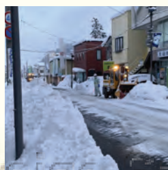
除雪、緊急対応(楯岡)