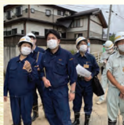
知事とともに水害対応 (西郷)