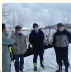
地元要望の立ち合い (戸沢)