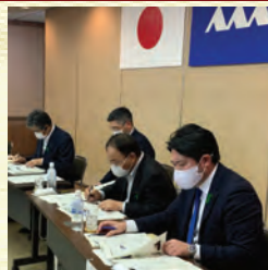
地域議員協議会にて 地元の課題を訴える