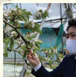
凍霜害、現地調査(楯岡)